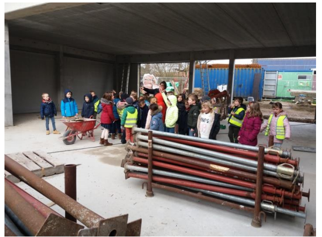
Op verkenning in de nieuwbouw (2 de lj.)