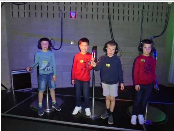
Naar technopolis (2 de graad)