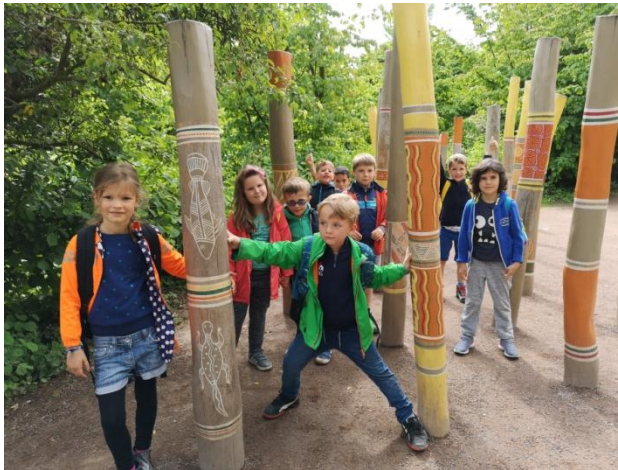
Planckendael (1 ste en 3 de graad)