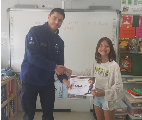
Uitreiking diploma MEGA (6 de lj.)