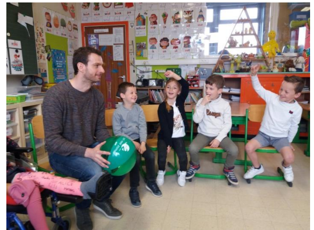
Praten over gevoelens (1 ste lj.)