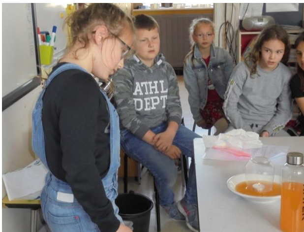
Proefjes techniek (2 de graad)