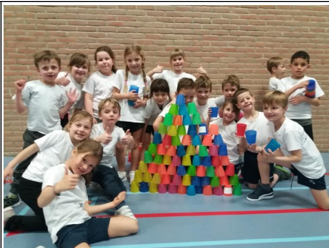
Kronkeldiedoe (1 ste graad)