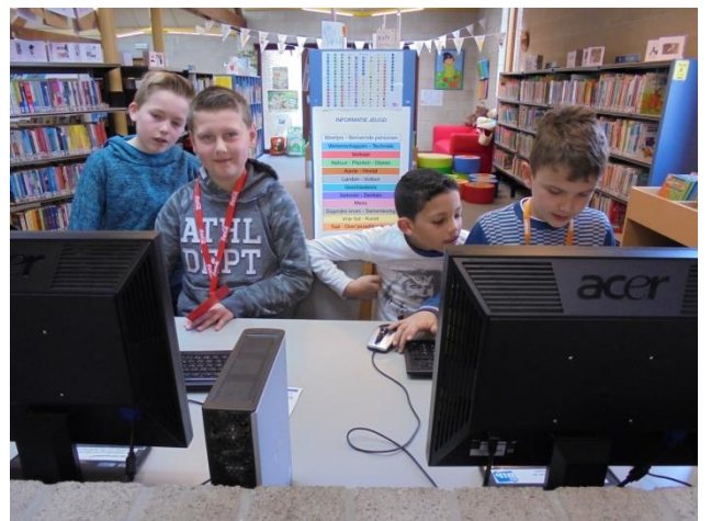
Naar de bib (4 de lj.)