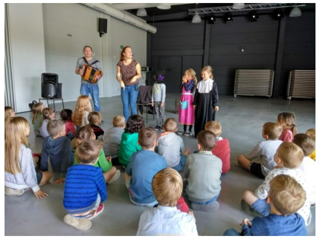
Appelmoesband (kleuters en 1 ste graad)