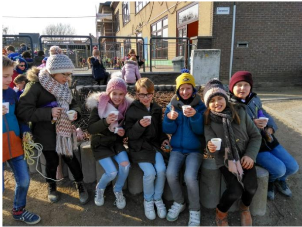
Dikke truiendag: lekkere warme soep!