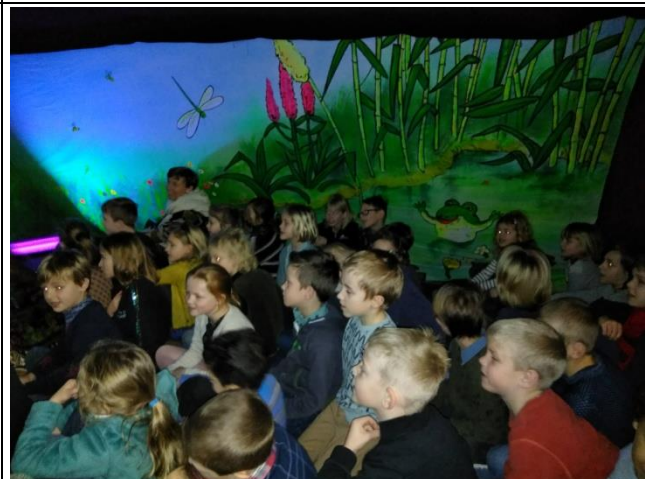
Mr. Guy's verteltent (kleuters, eerste graad, 3 de lj.)

NA HET CARPOOLEN, NU OOK HET HUISWERK POOLEN