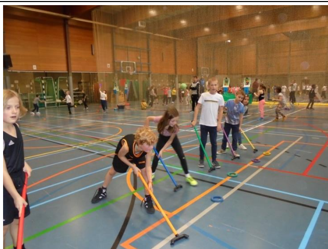
Alles met de bal (2 de graad)