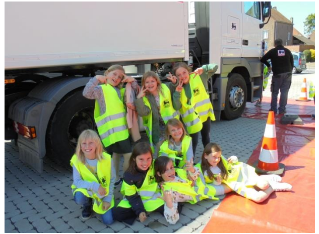
Dode hoek: lagere school