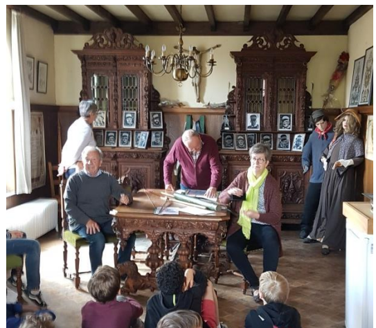
Tentoonstelling: Kunst in Lege Huizen (2 de en 3 de graad)