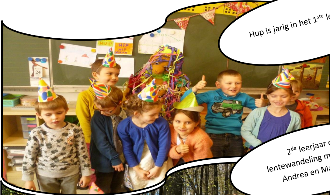
Hup is jarig in het 1 ste leerjaar