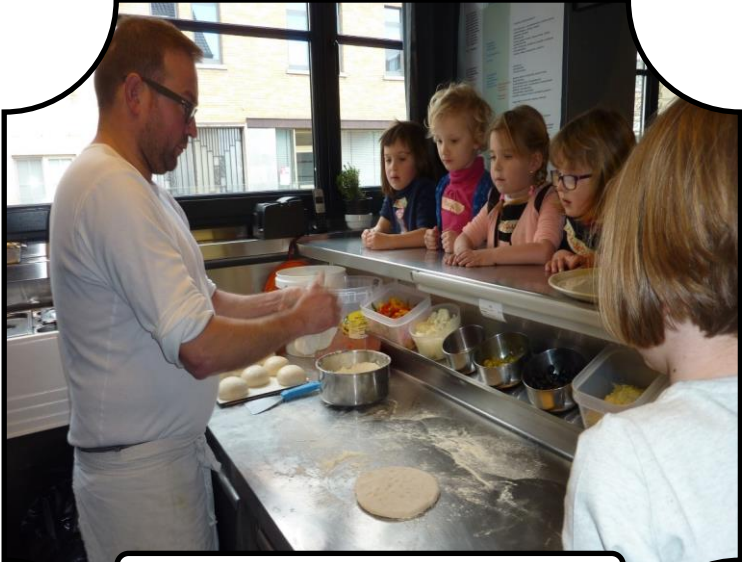
2 de kleuterklas naar de pizzeria