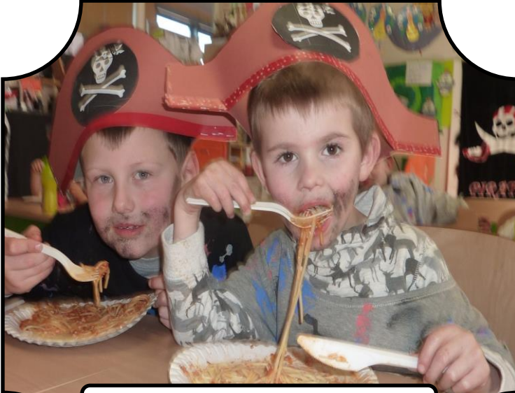
Piratenfeest 1 ste graad