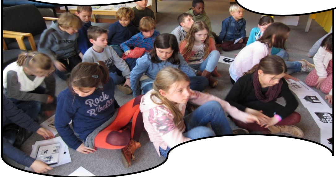
Jeugdboekenweek: 4 de leerjaar aan het werk in de bib