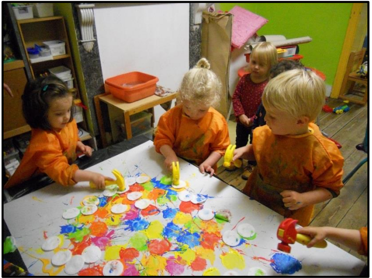
Kunstenaars aan het werk