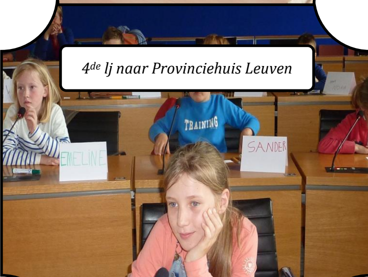
4 de lj naar Provinciehuis Leuven